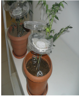
Şekil 1- Petri kapları içine alınan domates bitkisi yaprakları

Petri kabının alt ortasına 100 cm uzunluğunda telden, helezon şeklinde yapılan ve gerektiğinde çekilerek uzayabilen ayak yapıştırıldıktan sonra saksı toprağının üzerine yerleştirilmiş ve bu şekilde bitkiden yaprak koparılmadan zararlının biyolojik dönemleri izlenmiştir. Petri kabının bir kenarında domates dalı girecek şekilde açıklık oluşturulmuş ve dalı petri içerisine yerleştirildikten sonra zararlının kaçışını engellemek amacıyla dalın etrafı küçük sünger parçaları ile sarılmıştır (Şekil 1).