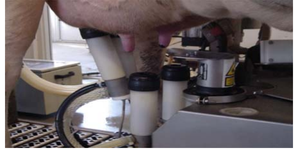
Şekil 5. Sağım başlıklarının takılması

sağım işlemi başlatılmaktadır. Sistemin giriş kapısı elektronik olarak kapandıktan sonra elektronik yemleyiciler ile yem verilmektedir. Sistemin bir parçası olan metal robot kol ineğin altına doğru gelmekte ve metal robot kolun üzerine monte olan yıkama sistemi ile meme başları temizlenmektedir. Yıkama işleminden sonra temizleme işlemini yapan silindir şeklindeki fırça geri çekilmektedir ve lazer ünitesi ile ineğin meme başlarının konumları belirlenmektedir. Lazer sistemle meme başlarının yerleri belirlendikten sonra metal robot kol üzerinde bulunan sağım başlıkları ineğin memesine takılmaktadır. Her bir sağım başlığı kendi ölçme aygıtına sahiptir. Süt akışı azaldığında sağım başlıklarındaki vakum azalmakta ve sağım başlıkları çıkarılmaktadır. Bütün sağım başlıkları çıkarıldıktan sonra, metal robot kol üzerinde her sağım başlığı yıkanmakta, metal robot kol tekrar ineğin altına doğru hareket etmekte ve her bir meme başına dezenfektanlı solüsyon püskürtülmektedir. Bu işlem de tamamlandıktan sonra çıkış kapıları açılmakta ve inekler sağım durağından ayrılmaktadır (Halladay 1999, Cooper 2001, Gearin 2001, Dick 2002, Hopster ve ark. 2002, Rodenburg 2002, Radfor 2003, Wilson 2003, Halachmi 2004, Anonymous 2005a). Şekil 5 'de sağım başlıklarının takılması ve Şekil 6'da sağım işlemi yer almaktadır.