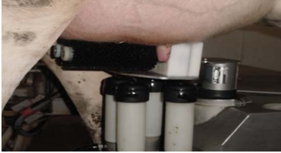
Şekil 4. Robotlu sağım sisteminde fırçalarla meme ve meme başlarının temizlenmesi