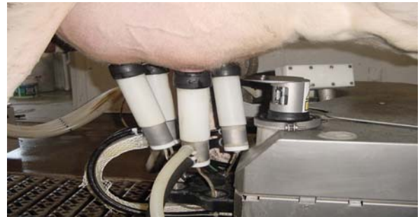
Şekil 6. Robotlu sağım sisteminde sağım işlemi ( http://www.uwex.edu/uwmrll/robot/photos/rpmain.htm )