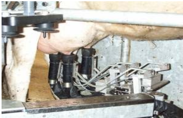
Şekil 2. Sağım yapılırken robot kolun yandan görünüşü

d) Sağım durağı: Sağım durağı ineğin durduğu ve zapt edildiği yerdir. Keza durak, robotun manevra yapma kabiliyetine sahip olan kolunun bulunduğu, yem verildiği, giriş ve çıkış kapılarını içeren farklı aksesuarların monte edilmesi gibi çeşitli konularda hizmet vermektedir (Graves 2002).