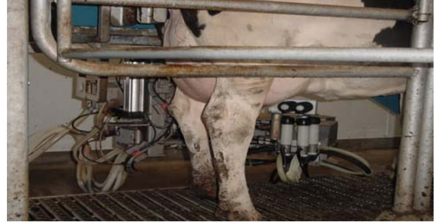
Şekil 3. Bir robotlu sağım sisteminde ineklerin sağıldığı sağım durakları ( http://www.uwex.edu/uwmri/robot/photos/rpmain.htm )

e) Otomatik kapılar: Elektrikle çalışan otomatik kapılar, sisteme ait olan sağım durağına giriş ve çıkış noktalarında bulunmaktadır. Sağım durağından önce ya da sonra bulunan bu kapılar ineğin sağım durağında tutulması ya da sağım durağı çıkışında kullanılmaktadır. Ağırlık ya da yay ile çalışan tek yönlü giriş kapısı, inek hareketinin kontrolü için kullanılmaktadır (Graves 2002).