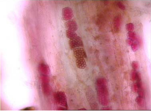
Şekil 2. Polymyxa betae 'nin şeker pancarı bitkisi köklerinde oluşturduğu sistosporileri (400X).